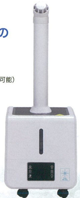
PK-804S-EP3000 ※メインパイプのみ装着時の画像です。

POINT 5 間欠運転機能(1、3、5分間隔) 1分運転 → 1 or 3 or 5分停止 → 1分運転