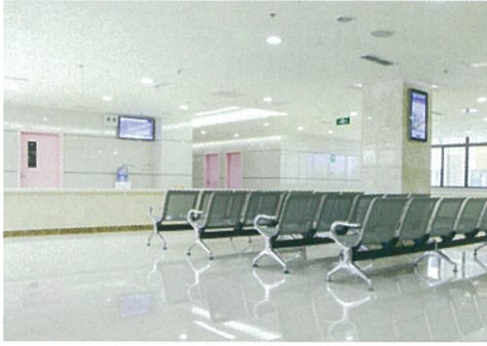
病院受付・待合室