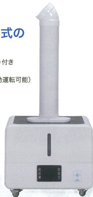
PK-808S-EP6000 ※シングルミストパイプ装着時の画像です。

POINT 5 間欠運転機能(1、3、5分間隔) 1分運転 → 1 or 3 or 5分停止 → 1分運転