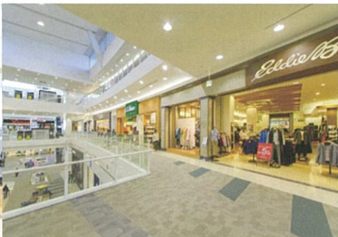
ショッピングモール・百貨店など