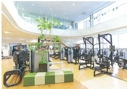
スポーツジム・体育館など