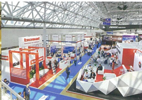
イベント会場(展示会など)